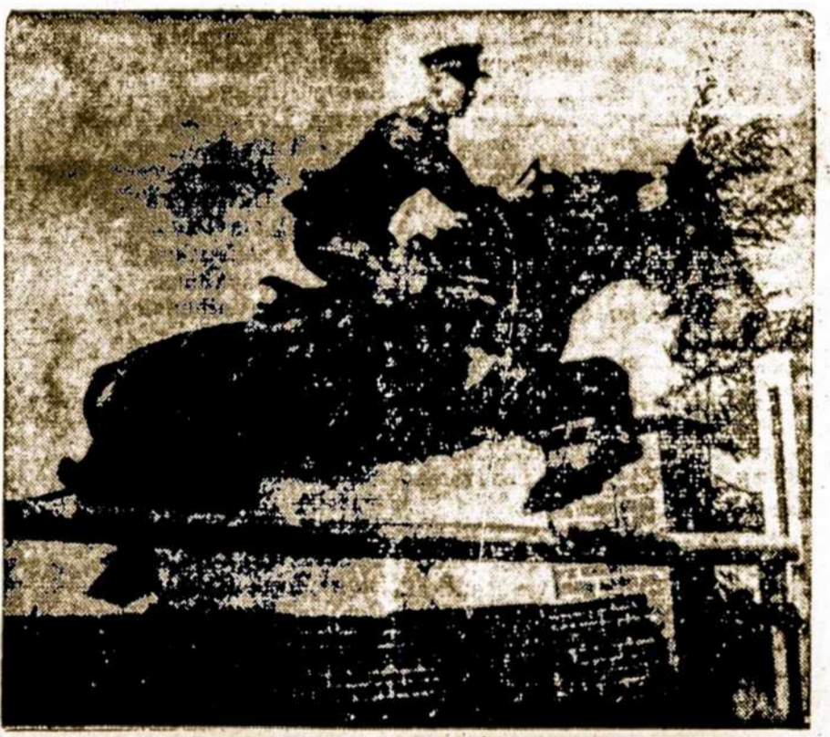
Nepriklausomybės laikų Lietuvos kariuomenės raitelis.

Vasarotojai prašomi iš anks- to užsisakyti kambarius „Li- tuania“, prie pat ežero Cala- munchita, turi geriausių pa- togumų savo skaitlingiems vasarotojams.