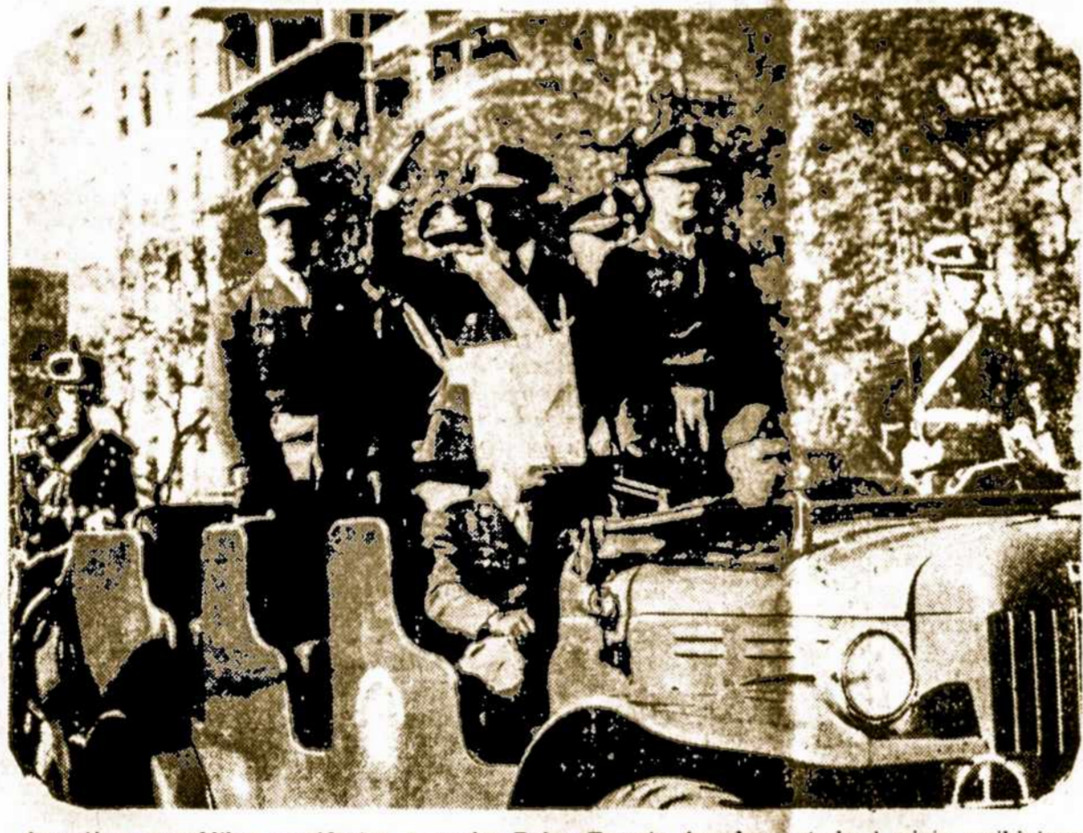
Argentinos respublikos prezidentas, generolas Pedro Eugenio Aramburu atsako į minių sveikikinių Liepos 9, 1956, Argentinos Nepriklausomybės 140 metų sukaktį minint.