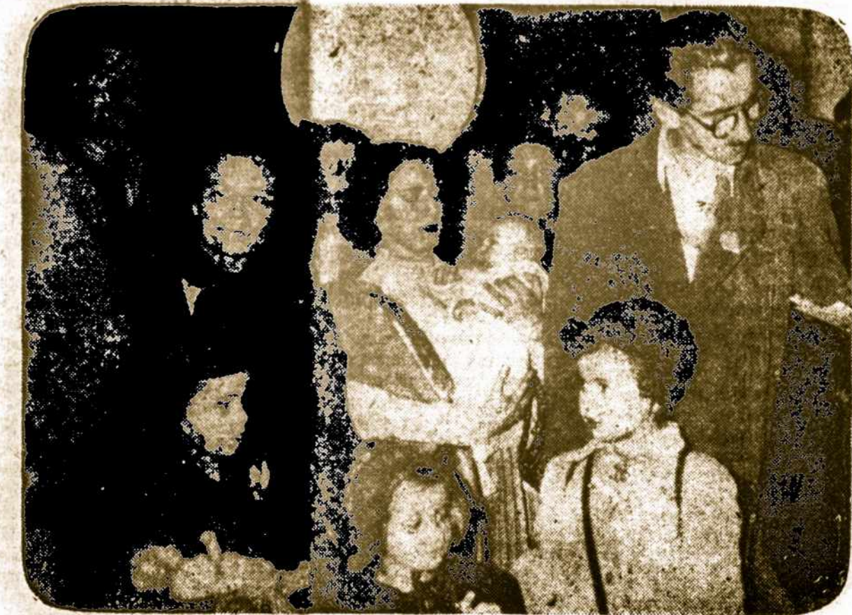
Si pirmoji Vengrijos pabėgėlių grupė iš 20 asmenų pasiekė Argentiją Naujų Metų išvakarėse. Visi apsigyveno pas savo gimines. Argentina priima 10,000 Vengrijos pabėgėlių. Iš 158,347 Vengrijos pabėgėlių į JAV. jau atvyko 20,387, Anglijon 31401, Vakarų Vokietijon 10,935, Šveicarijion 10,300. Brazilija įsileidžia 3,000. Kiti keliauja į dvidešimtį Vakarų pasaulio šalių. Kremlius visus šaukia atgal... kad paskui juos nužudyti.

—Sirijos sostinė Damasko atskrido 12 sovietinių karo lėktuvų Mig-17. Rusų ir čekų laktūnai ruošia vairuotojus sirijiečius.