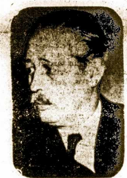
Harold MacMillan, naujasis Anglijos premjeras.

MacMillan yra sūnus škoto spaustuvininko ir motinos amerikietės. Spalio mėnesį, 1956, Mac Millan lankėsi Vašingtone, dalyvaujamas Tarptautinio Valiutų Fondo susirinkime.