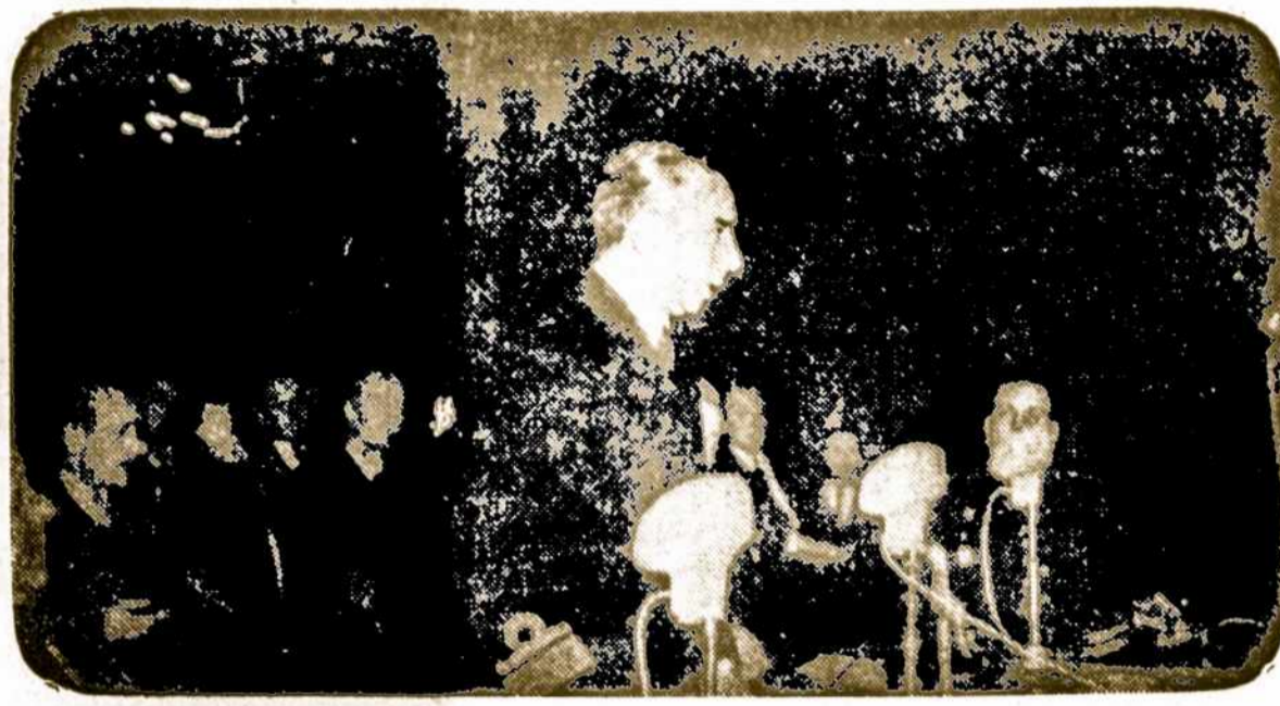
Argentino, Brazilijos, Paragvajaus, Urugvajaus ir Bendros Amerikos Gynimo Tarybos delegatai, su JAV generalinio štabo atstovais prysakyje, suvažiuo į Buenos Aires, kad išdirbti Pietų Atlanto Organizacijos gynimo pagrindus. Nuotraukoje: Kalba Argentinos viceprezidentas admiras Isaac F. Rojas, 15. 5. 57, pradedamas šis svarbų pasitarimas, vykstantį Argentinos Aukštosios Karo Mokyklos rūmuose.

—Prancūzijos premjeras Guy Mollet su visu ministerijų kabinetu 21. 5. 57 atsistatydino. Prezidentas Coty tariasi su radik-