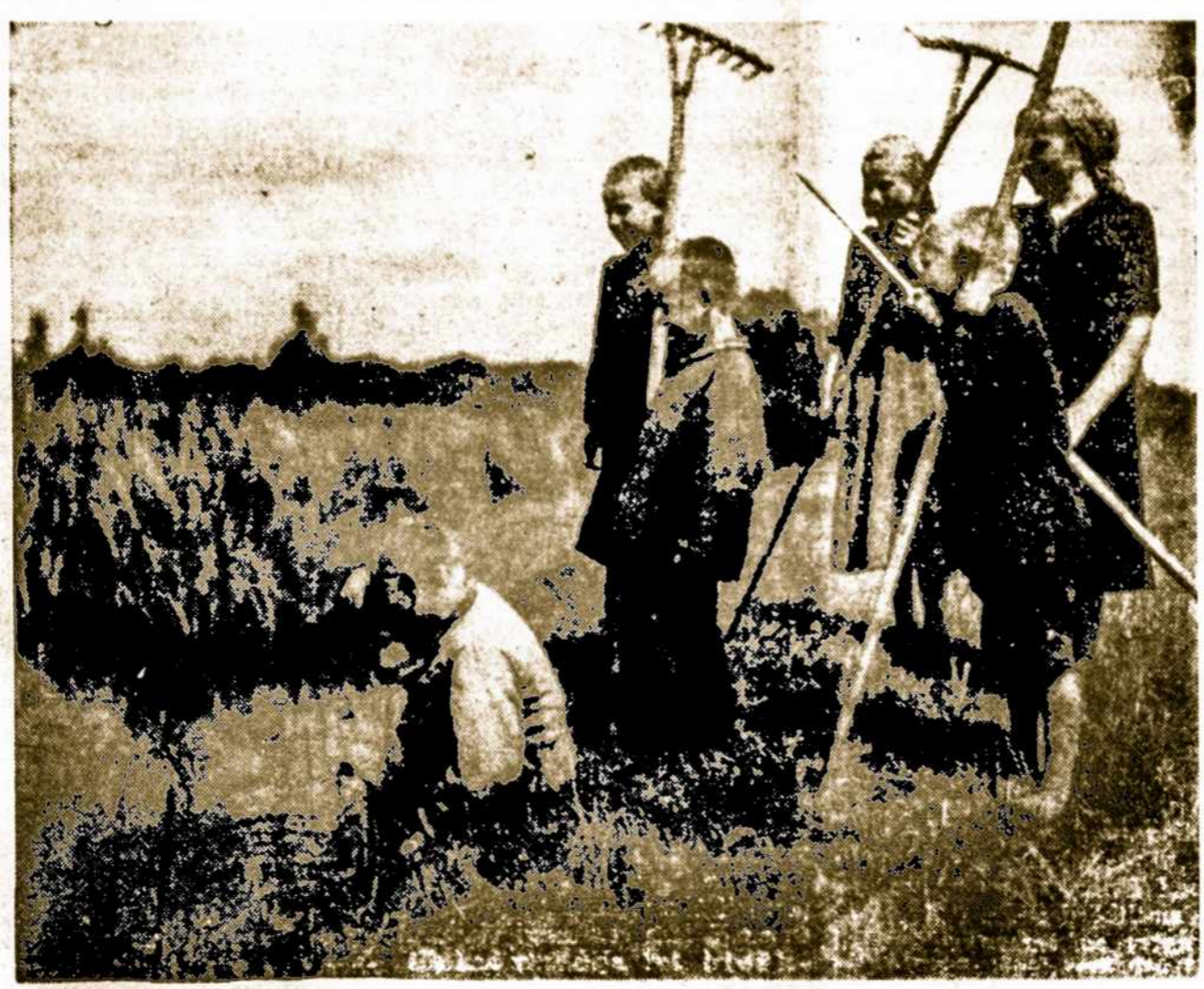
Mažas piemenėlis — didis vargdienėlis ypatingai dabar, vyresniusius ištrėmus į Sibirą.