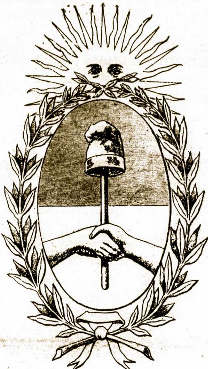
Argentinos Valstybinis herbas — Escudo Nacional.