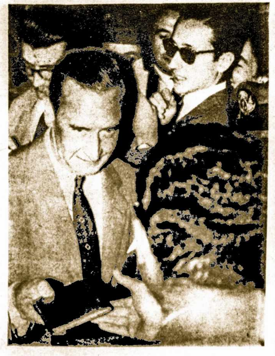
Gen. Pedro Eugenio Aramburu, laikinasis prezidentas, įteikia savo pilietybės knygelę balsavimo kontrolės komisijos pirmininkui 23. 2. 58, c. Santa Fe 1510, Buenos Aires, kur jis atliko savo pilietinę pareigą.