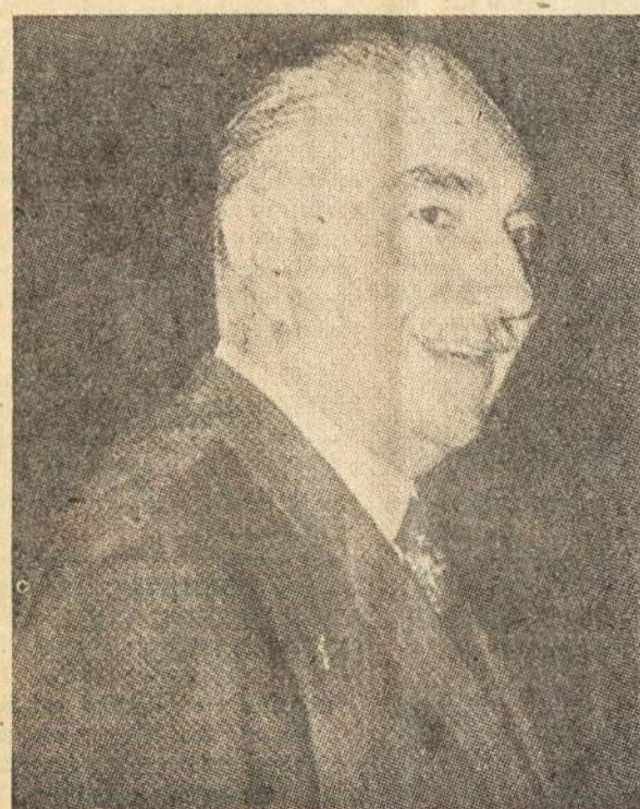
Dr. Oscar Alende, Buenos Aires provincijos gubernatorius, naudingų reformų autorius.

— Japonijos gyventojai 6. 8. 59 minėjo Hiroshima tragedijos 14-kos metų sukaktį. Pasisakyta prieš atominių ginklų vartojimą. — Sovietų premjeras Chruščiovas, vykdamas į Vašingtoną arba grįždamas, sustos Londone.