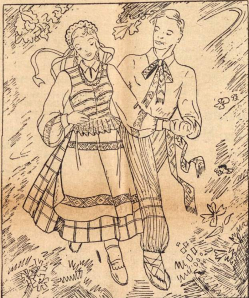
Paminėjom Tetos dieną, Taipgi Tėtės ir Mamos, Šį šeštadienį suktinis Dėl Pavasario kaitros...

Ir dygdo Dyguos dagiai, Dyguos dilgėlėlės.