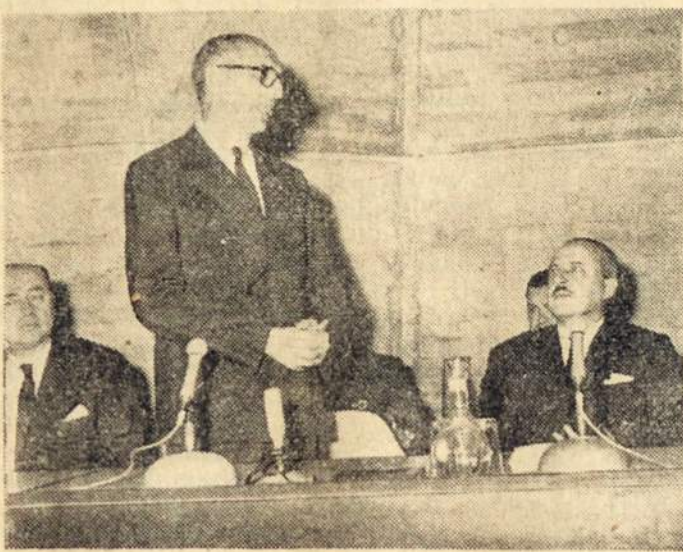
DEŠINĖJ: Po 28 dienų triumfališkos kelionės, sudaręs Argentinai palankias sutartis su Vakarų Europos valstybėmis, 11. 7. 60 Dr. A. Frondizi, savo vietininko Dr. Guido sutiktas Ezeiza aerodrome. KAIRĖJE: Dr. A. Frondizi, lankydamsis Paryžiuje, kalba UNESCO centre. Kairėje generalinis tos JT org. dir. Veronese.