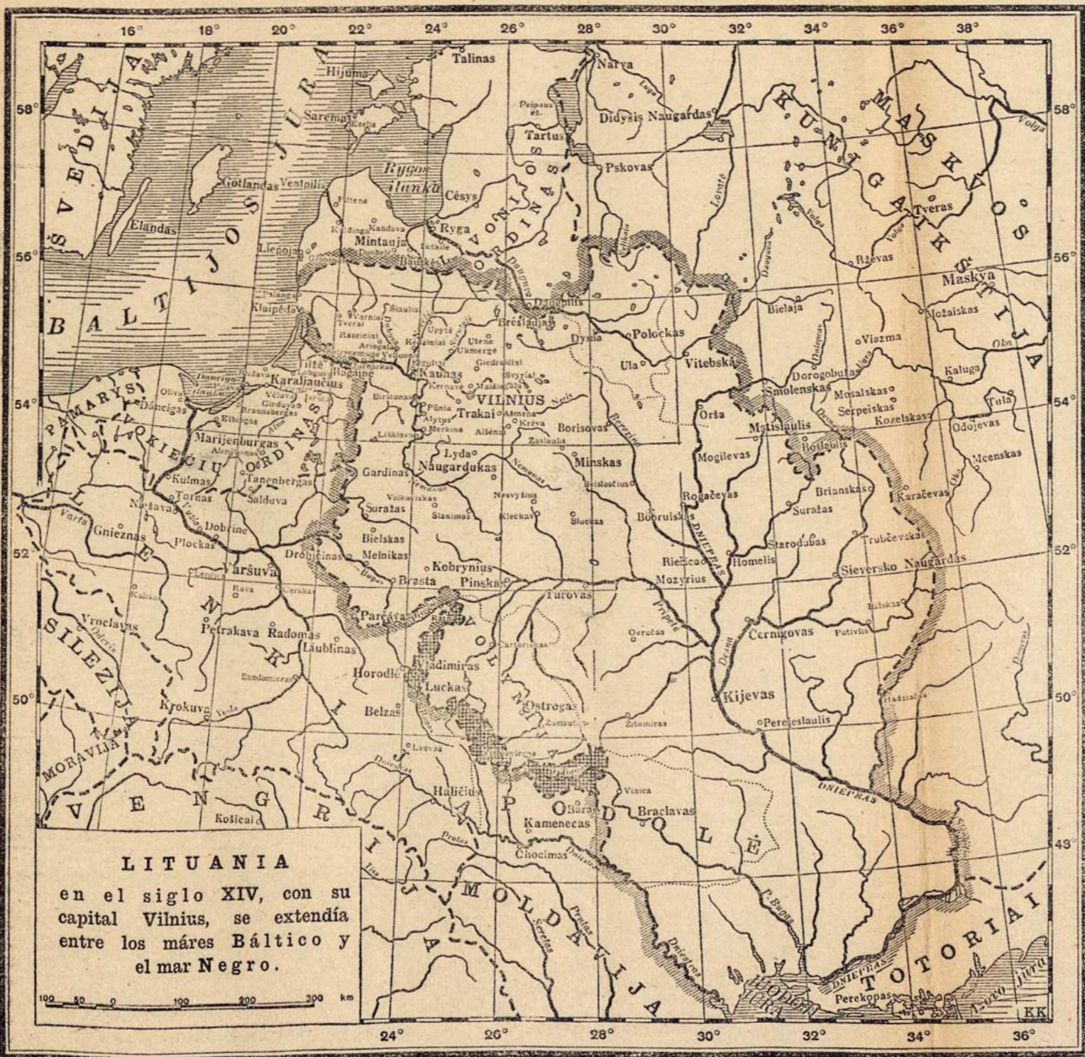
LITUANIA en el siglo XIV, con su capital Vilnius, se extendía entre los mares Báltico y el mar Negro.