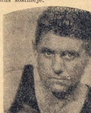
Luis Angel Firpo