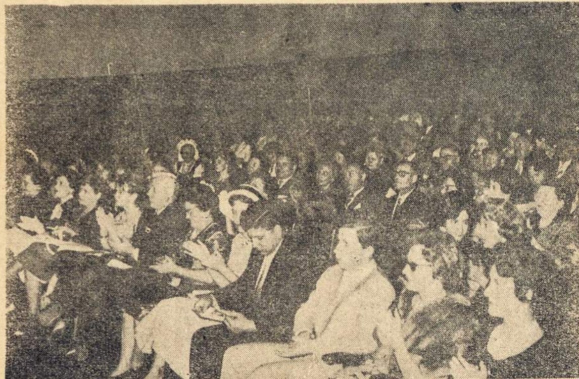
Publikos dalis Aula Magna salėje, kur dalyvavo rinktinė lietuvių publika, argentiniečių ir kitų tautų intelektualų, dainos meno mylėtojų ir spaudos atstovų. Šiuo koncertu gražiai pagarsintas geras Argentinos lietuvių kolonijos vardas.