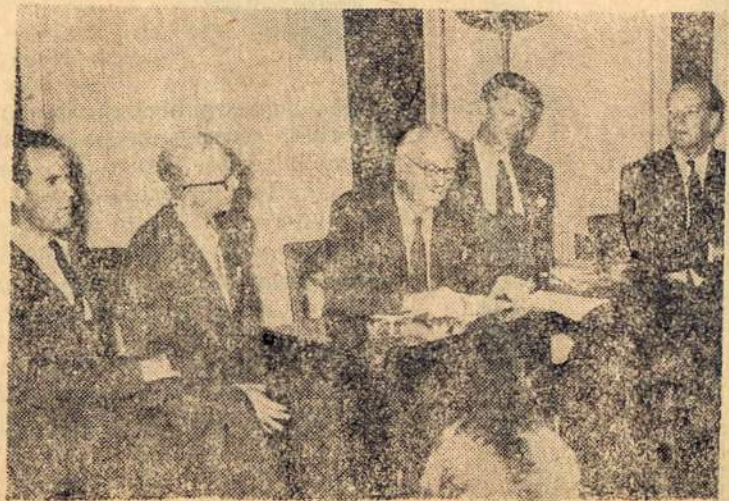
Palermo stadione vykstančios Tarptautinės automobilių parodos komitetas, 1.12.60 spaudos konferencijoje.