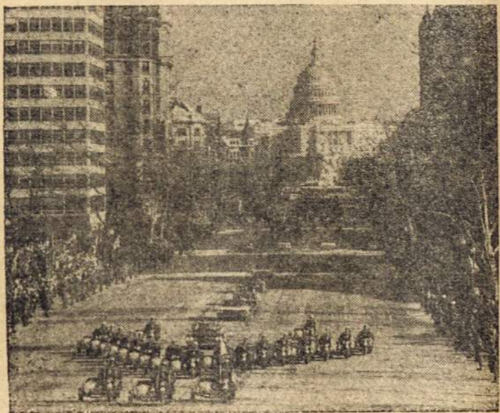
Vašingtono alejoje Pennsylvania, 20.1.61, nepaisant šalčio, milijonas žmonių stebėjo kariuomenės paradą, prezidento J. F. Kennedy inauguracijos iškilnių progą. Visos šalies gyventojai klausė radio ir stebėjo televizijoje. Gilumoje — Baltieji Rūmai.

Nėra abejonės, kad šitas humaniškas žmogus tikrai atjaučia ligonis ir senus žmones. Juk šiame krašte žmogus gali taupyti 10-20 metų, bet jeigu jam tektų metai kiti gulėti ligoninėje, pakelti operacijas, tai greičiausiai jo viso gyvenimo santaupos pranyktų, mokant gydymo sąskaitas. Tų organizacijų kova, kad nebūtų suteikta neturtingiems ligoniams valstybinė medicinos pagalba, ro-