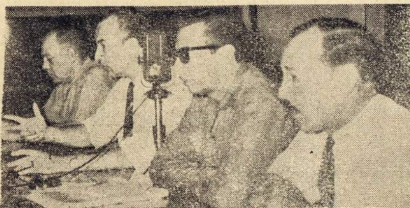
Argentinos Darbo Konfederacijos vadovybė posėdžiauja CGT rūmuose, po kardinolo Caggiano nepavykusių pastangų taikos keliu likviduoti antras mėnesis besitęsiantį geležinkeliečių streiką.

— Rosario miesto šiaurinėje dalyje, prie fabriko Ceramica Alberdi, statybos bendrovė Field Argentina pradėjo statyti 2.100 gyvenamųjų namų.