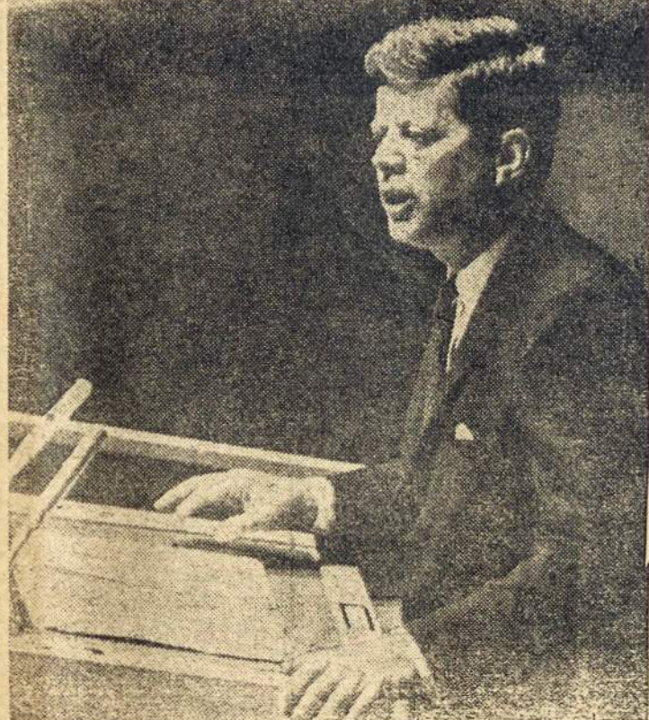
KAIRĖJE: „Sagos paspaudimo“ tarpkontinentinis amerikiečių ginklas, trijų etapų minutininkas, iš Cabo Canaveral nuskrudis 6.720 kilometrų. DESINĖJE: JAV prezidentas John F. Kennedy, paprašiusis Kongresą patvirtinti milijardines sumas apgynimui Amerikos demokratijos.