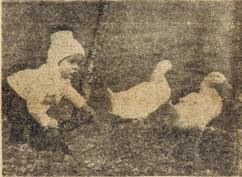
Danijos Kopenhagos parke fotografas nutraukė šį ramų vaizdėlį: Vaikas ir trys antys. Stebinti šį vaizdą, užmirštami šalti ir karšti karai.

— D. Šantaraitė , su tėvais iš Buenos Aires emigravusi Chicago, 2. 10 61 ten baigė medicinos technikos akademiją ir gavo laboratorijos X-spindulių technikos diplomą.