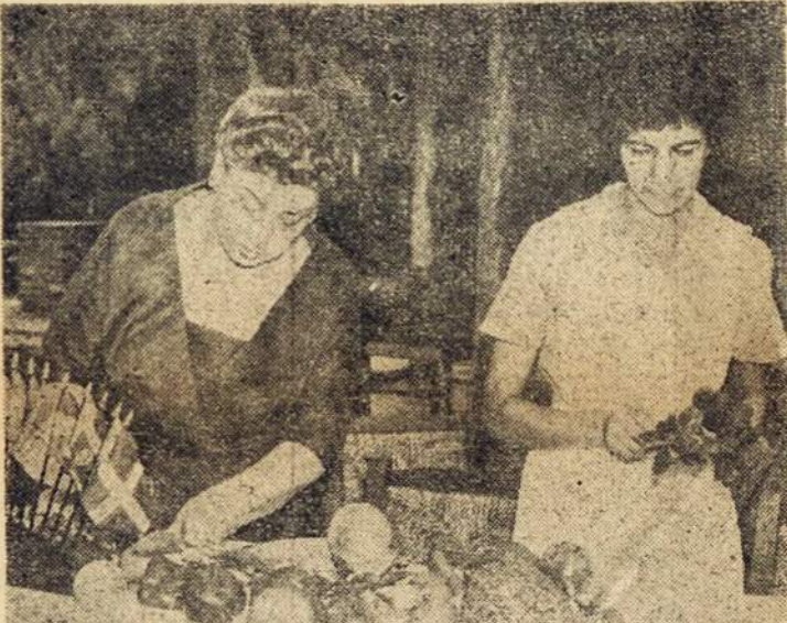
Vykstant Amerikos kontinento valstybių u. r. ministerių VIII pasitarimui Punta del Este, Urugvajaus Valstybės Tarybos pirmininko Haedo žmona kasdien paruošdavo stalą savo gražioje rezidencijoje, priėmimui skaitlingų vizitų.