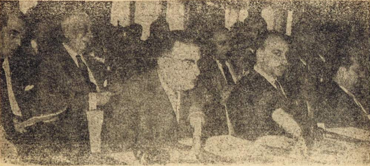
VIII Amerikos u. r. ministerių konferencija Urugvajaus vietovėje Punta del Este, 30. 1. 62 pašalino komunistinę Kubą iš OEA (iš Amerikos Tautų Organizacijos). Už pašalinimą balsavo 14 šalių: Urugvajus, Paragvajus, Peru, Kolombija, Venezuela, Panama, Costa Rica, Guatemala, Nicaragua, Honduras, El Salvador, Haiti, Dominikonų Respublika ir JAV. Einant OEA taisyklėmis, nuo balsavimo susilaikė Argentina, Brazilija, Chile, Meksika, Ekvadoras ir Bolivija. Nuotraukoje: Kolombijos u. r. min. ir tos šalies delegacijos pirm. Dr. J. J. Caicedo Castilla, kurio pateikti argumentai nusiųre Kubos pašalinimą iš Amerikos tautų organizacijos, kurioje ji varė didelę prosovietinę propagandą.