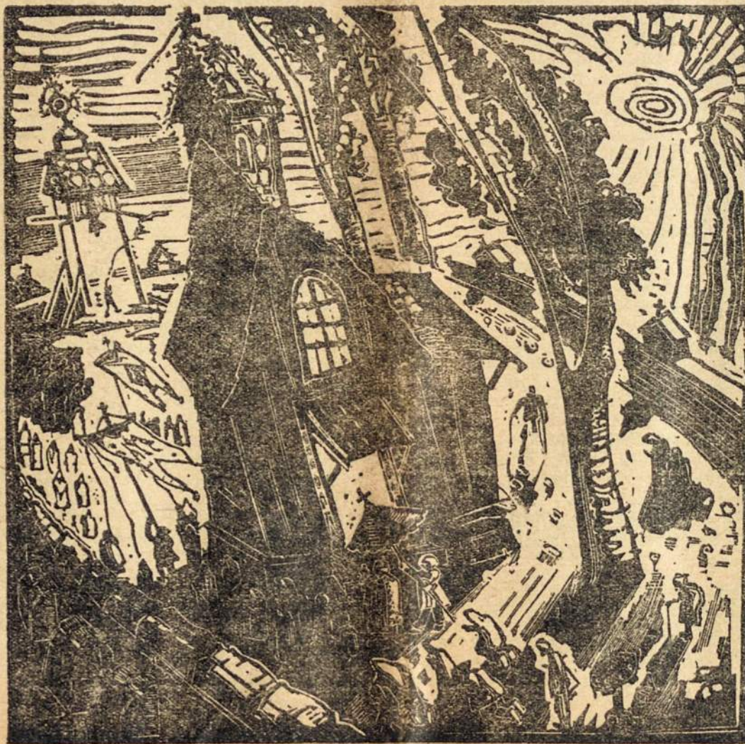
Velykų rytas Lietuvoj.