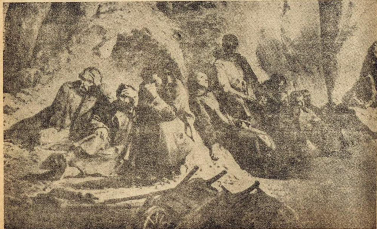
Nežmoniškos sąlygos gyvendami, be tinkamo maisto, be pritaikintos aprangos, mirdavo tremtiniai.

Mokytoja Š. surašė mūsų vargus ir paaiškinamąjį raštą, o drašioji valstietė Ž. sutiko tą raštą įteikti. Bet prieš tai ji žodžiu paaiškino enkavedistui, kad direktorius už kelis mėnesius mums nesumokėjo už darbą, kad mes neturim už ką nusipirkti duonos, kad mūsų vaikams neparduoda mas pienas, ir paklausė, ar direktorius turi teisę žiemos metu varyti mus į darbą be žiemos