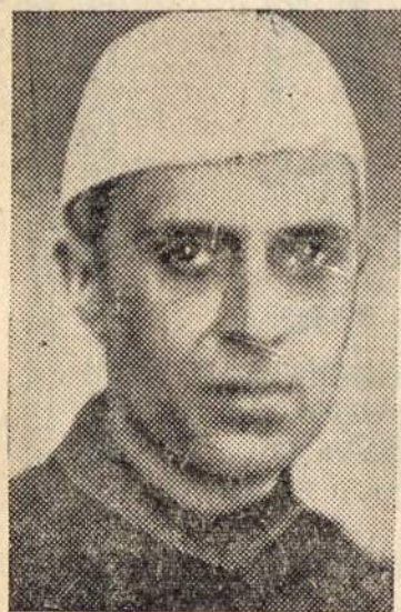
JAWAHARLAL NEHRU, Indijos premjeras, miręs 27.5.64.

— Chruščiovas žada pasiūlyt Vašingtono vyriausybei pasirašyti draugingumo sutartį su Maskva, po JAV prezidento rinkimų, kurie įvyks lapkričio mėnesį.