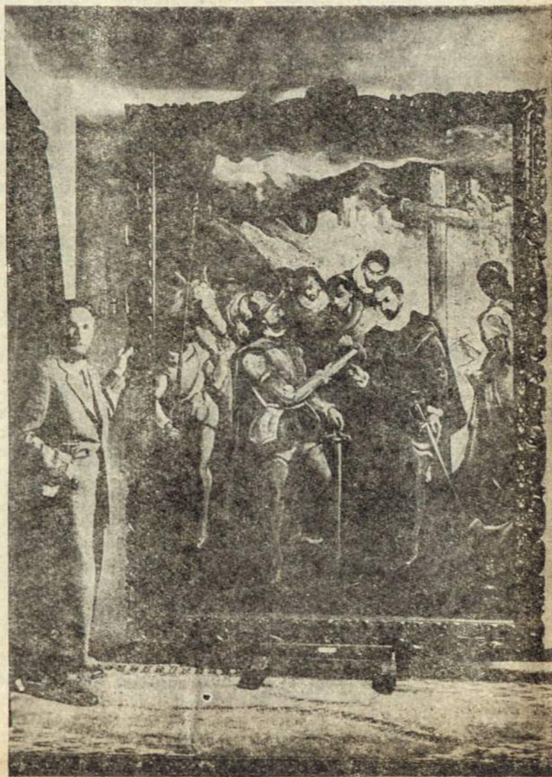
KAIRĖJE: „La Paz išteigimas“ — J. Rimšos. DEŠINĖJE: Argentinos Pavasarį vaizduojanti grakščios jaunuolės nuotrauka.