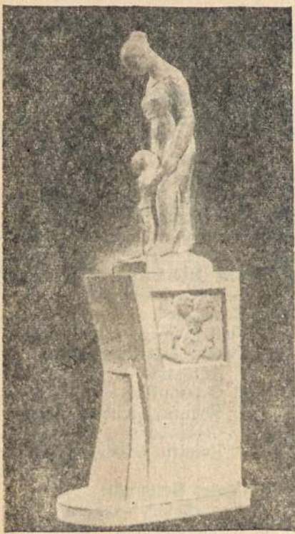
Villa Lugane, sankryžoje gatvių Av. Riestra ir Murguiondo Motinos garbei pastatytas šis paminklas, 1962 metais. Jo atidaryme dalyvavo ir A. L. Centro Ansamblio dalis. Jis nuolat yra papuoštas gyvų gėlių puokštemis, kas liūdi, kad žmonija myli savo Motinas.