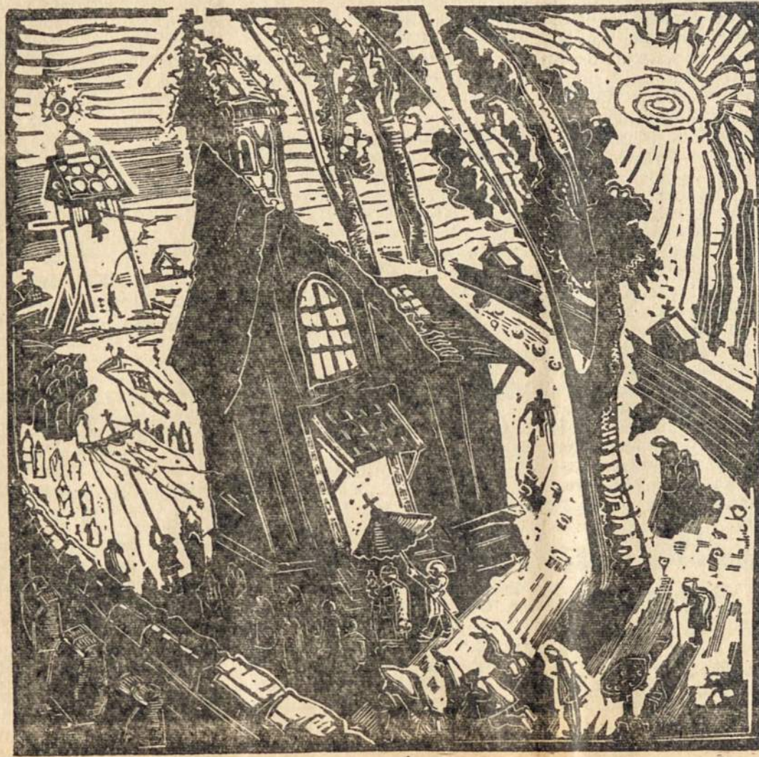
VELYKŲ RYTAS LIETUVOJ