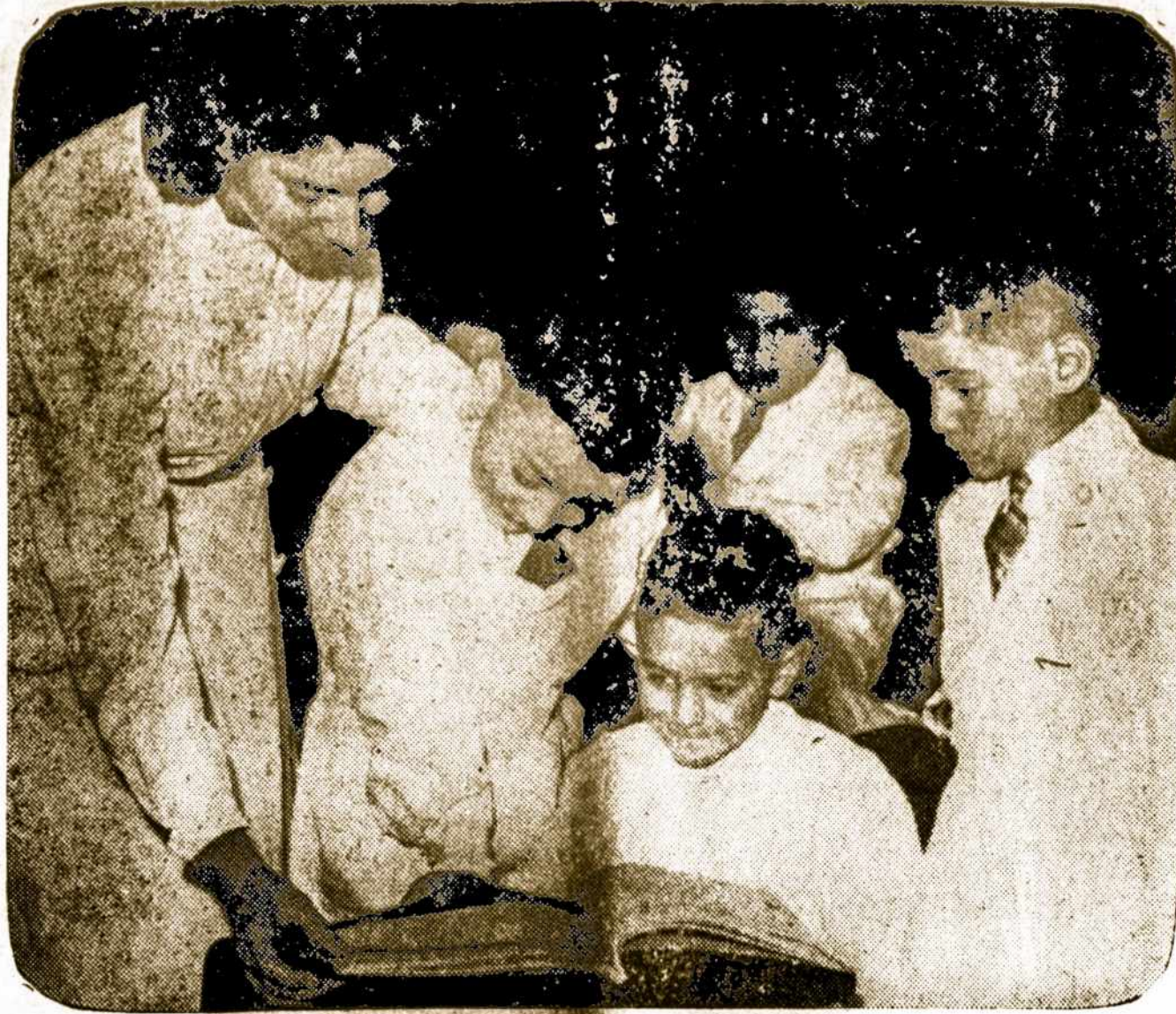
Žiemos atostogoms pasibaigus, mokinukai sugrūžėjo į mokyklas. Juos švelniai auklėdamos ir mokindamos mokytojos ruošia būsimus piliečius ir valstybės vyrus. Kaip pradinėse, taip vidurinėse ir aukštoje Argentinos mokslo įstaigose sutinkame liet. jaunimą.

Liepos 17, vakare, įvyko dainų šventė Vingio parke, liepos 18 Žalgirio stadione šokių ansamblių pasirodymai, vienas diena, kitas naktį. Liepos 16 atidaryta Respublikinė laudies ūkio ir kultūrinių pasiekimų paroda.