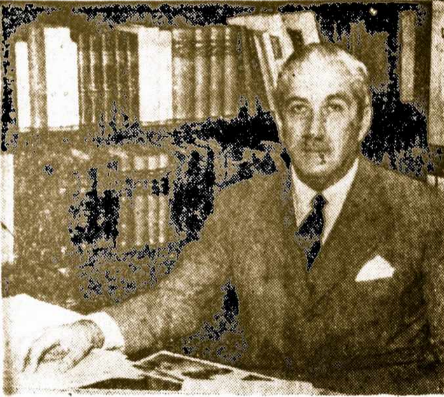
KAIRĖJE: JAV u. r. min. Dean Rusk su palydovu, 16. 11. 65 aplankęs Argentinos prezidentą Dr. Arturo U. Illia ir u. r. min. Dr. Miguel Angel Zavala Ortiz, su kuriais tarėsi Rio konferencijos reikalais. DEŠINĖJE: Dr. M. A. Zavala Ortiz savo darbo kabinete. Dabar jis dalyvauja 19-kos u. r. ministerių konferencijoje Rio de Janeiro mieste, kur ieškoma visos Amerikos kontinento tautų susiartinimo ir sklandesnio bendradarbiavimo. Rio konferencija prasidėjo lapkričio 17, 1965, viešbutyje Gloria.