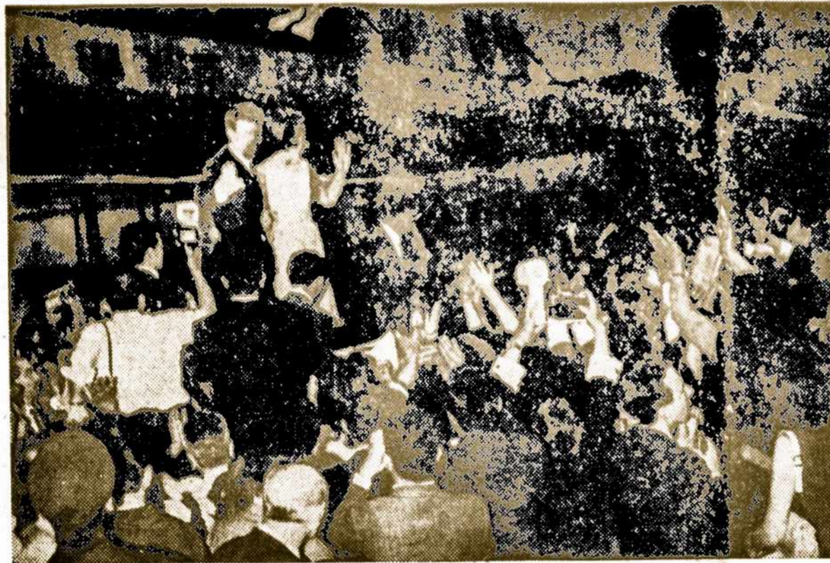
KAIRĖJE: JAV senatorius R. Kennedy su žmona kalba prie San Martin Teatro 28. 11. 65. DEŠINĖJE: Scena iš Luna Parko žaidynių 26. 11. 1965.