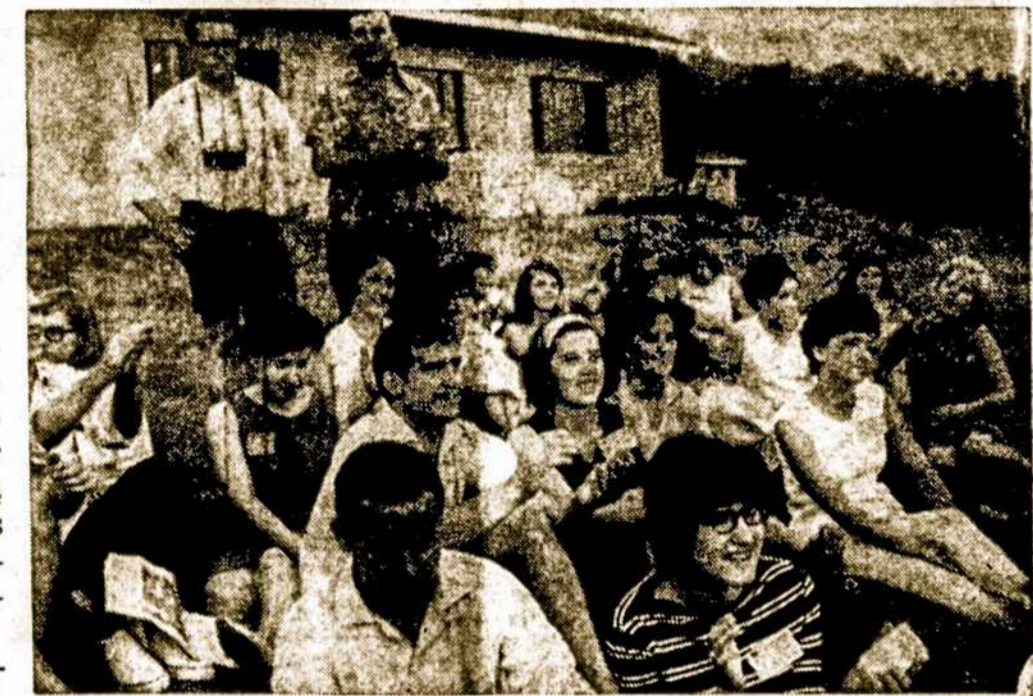
Argentinos lietuvių jaunimo atstovai su kolegomis Dainavos stovykloje, Manchester, Mich. 27.6.66, PLJ jaunimo Kongreso proga.

„Jeigu jau renkame, tai mūsų gražuolė turi būti visiškai kitokia, negu matome ant tualetinio muilo reklamų. Ji turi būti graži iš vidaus. Ji turi spindėti savo dvasinėmis vertybėmis. Ji turi būti lietuvių jaunulės idealas — nekurdia lietuvių tautos problemoms, pažįstanti savo tautos kultūrinį lobį, mokanti ir mylinti savo gimtąją kalbą; iš baimės nesi lankstanti ir nesimąžinanti svetimųjų aplinkoje, gyvai dalyvaujanti mūsų jaunimo visuomeniniame gyvenime. O jau savaime suprantama, kad ir savo išorine išvaizda negali būti kokia nors keizra ar baline suknele apvilktą karvutę, jeigu ją norime ir kitiems parodyti. Sakysime Bostono, nors niekas su matavimo įrankiais apie kandidatę netupėjo.“