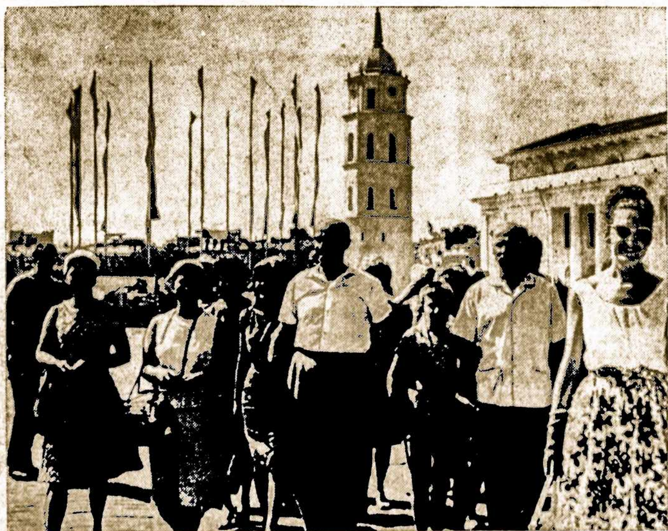
Mūsų senelį Vilnių pamėgo įvairių tautų turistai. Dabar Vilniuje yra geri, modernūs hoteliai, kur turistai randa visus patogumus, ir, kas svarbiausia — pigiau, negu kituose kraštuose — J. Juknevičiaus nuotrauka.

CHIRURGE — DANTISTE Av. del Trabajo 2879; TE. 66-8145, nuo 16 valandos: Pirmad., treč. ir penktad. Kitom dienom pagal susitarimą. Republicetas 2510, Dep. Pta. Baja; TE. 70-6860. Priima: Antradieniais ir ketvirtadieniais, nuo 16 iki 21 val. (Aukštuma Cabildo 3600) — Buenos Aires