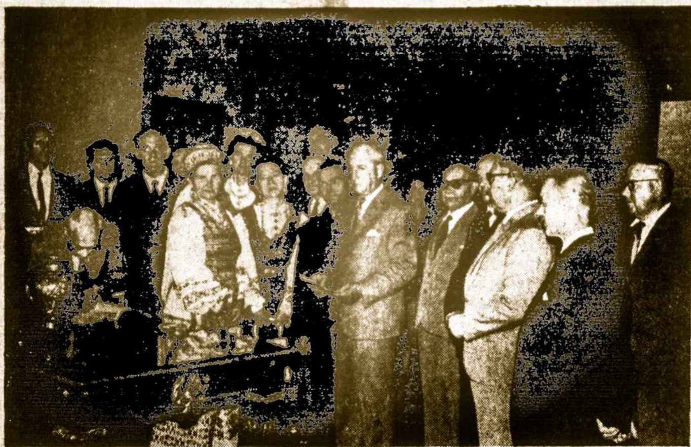
II Pietų Amerikos Lietuvių Kongreso metu padaryta nuotrauka, laike apsilankymo pas Montevideo miesto intendenta, jo kabinete. Su Urugvajaus lietuviams matosi ir Argentinos bei kitų šalių lietuvių delegacijos.