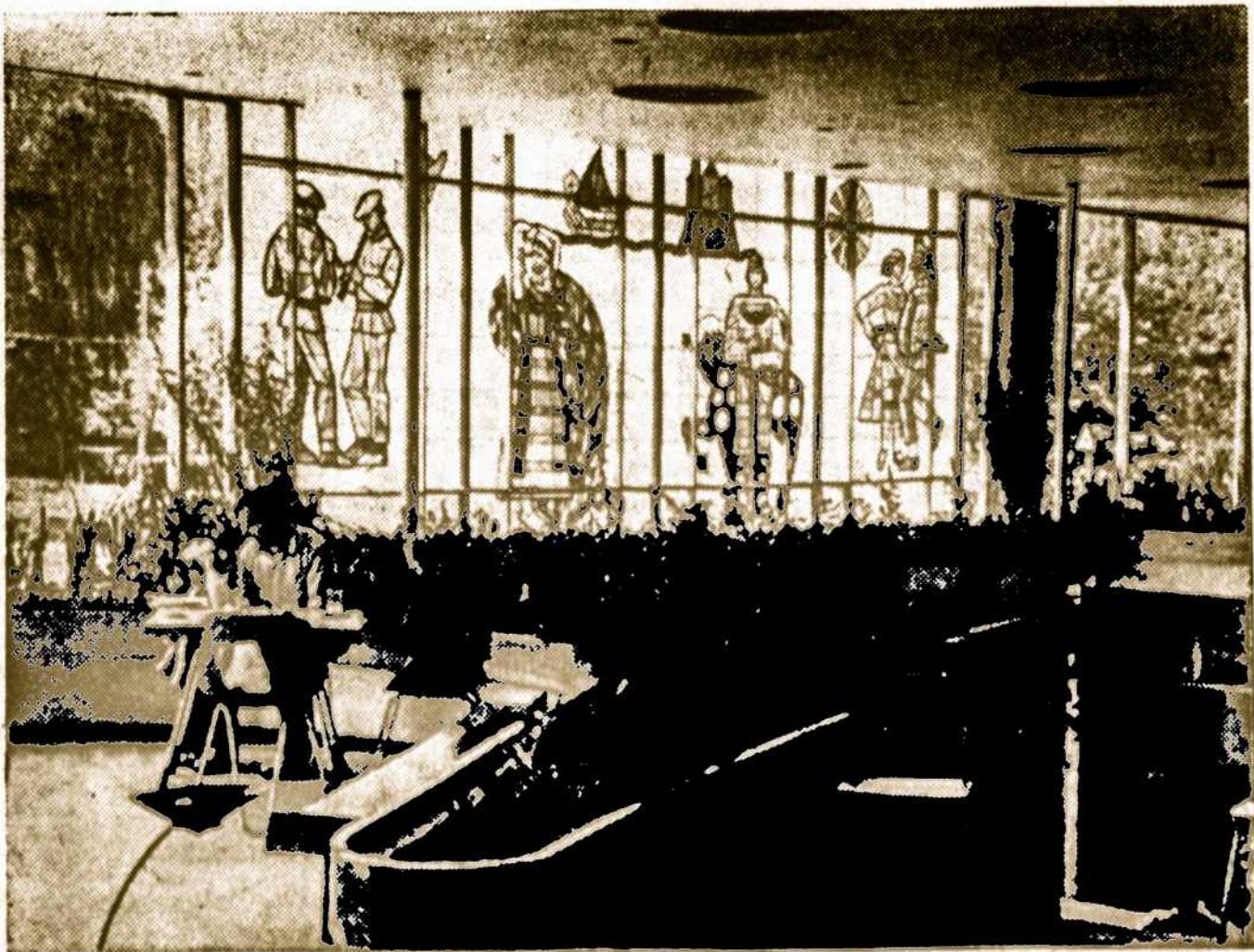
Druskiniškų kavinė "Dainava".