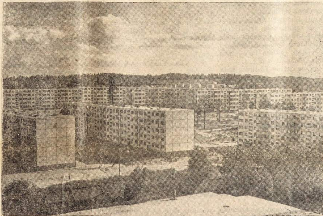
Vilniaus apylinkėse, prie Neries, išaugo ištisi kvartalai modernių namų pastatytų iš cementinių blokų, kuriuose gyvena darbininkai ir valdininkai su savo šeimomis.

XIV amžiuje susikūrė šeši Lietuvos miestai. Oficialia Kauno įkūrimo data laikomi 1317 metai, nors lietuviai toje vietoje jau X amžiaus pradžioje buvo įrengę sustiprinimus. Vilniaus miesto įkūrimo metai laikomi 1323-ieji, kai Vilnius buvo paskelbtas Lietuvos sostine. Bet Vilniaus gyvenvietė buvo įkurta jau X amžiuje. Pirmosios, ne visai patikimos metraštinės žinios skelbia Vilnių buvus 1128 metais. 1341