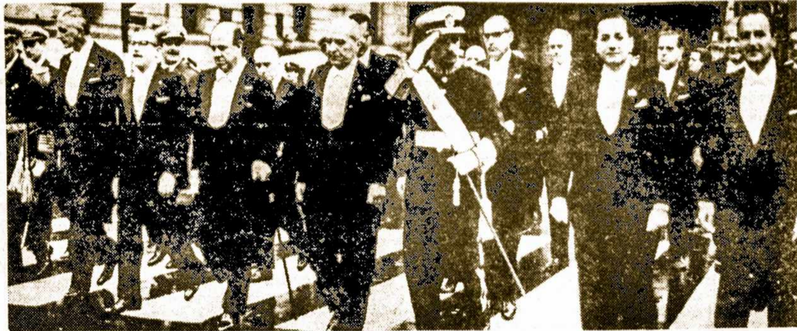
Mimint 157 m. Argentinos Revoliucijos sukaktį, 25. 5. 67, prezidentas gen. J. C. Ongania su ministraiais iš Vyriausybės Rūmų per 25 Gegužės aikštę eina į istorinį Cabildo namą.