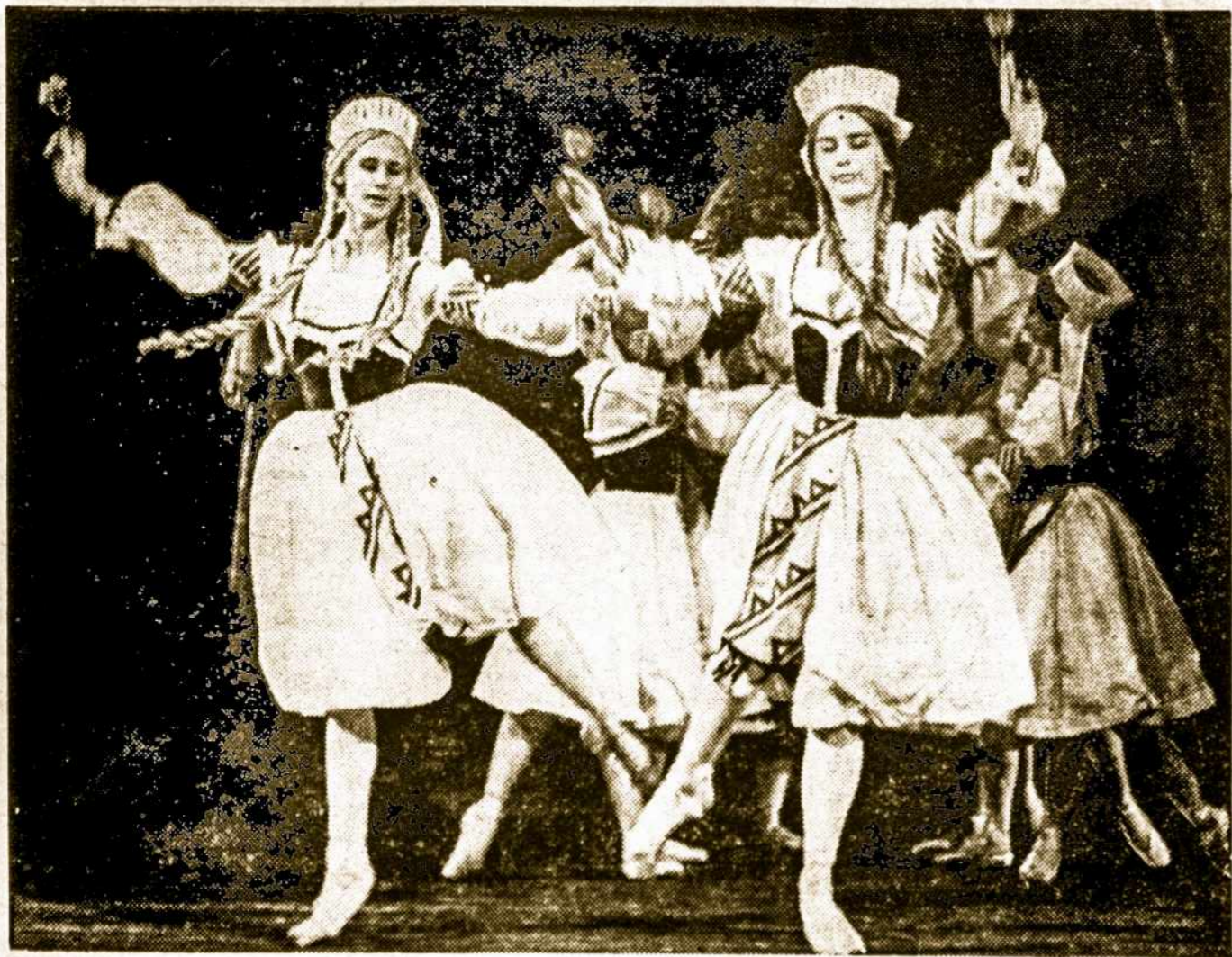
Scena iš Gruodžio baletu "Juratė ir Kastytis"