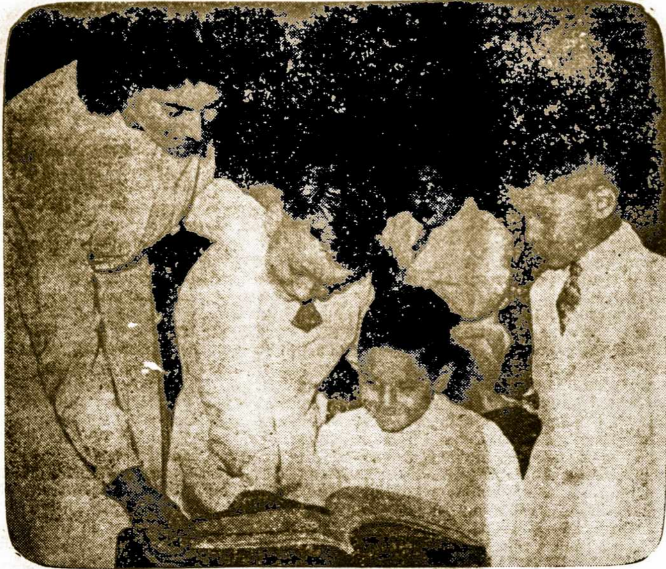
Po žiemos atostogų vėl prasidėjo mokslas Argentinos mokyklose.