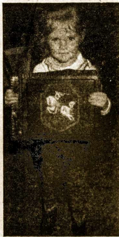
Aš Jums sakau: Geriausia dovana Vaiko Dienos proga A. L. Balso laidos albumas!

— Sukaktuviniai A. L. Balso spaudos darbo metai — 1967 — tieji — maloniai minimi daugelyje Lietuvos išėivių laikraščiu. Pirmieji su realia parama atsiliepė Venezuelos lietuvių, peremdami Pietų Amerikos lietuvių spaudos veteraną su 25 dolerių suma.