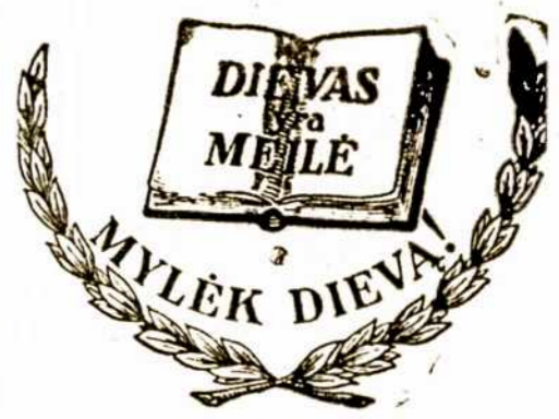
KRISTAUS TAURĖ (Rašo Billy Graham)