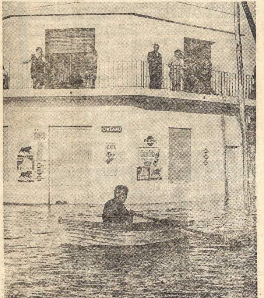
Netoli SLA, Avenida San Martin, vieton automobilių, virš asfalto iriasi piletis.

— Automobilių fabrikas CIDA SA, Monte Chingolo, paskelbė bankrotą. Jo pasyvas siekia apie 10.000 milijonų pezų.