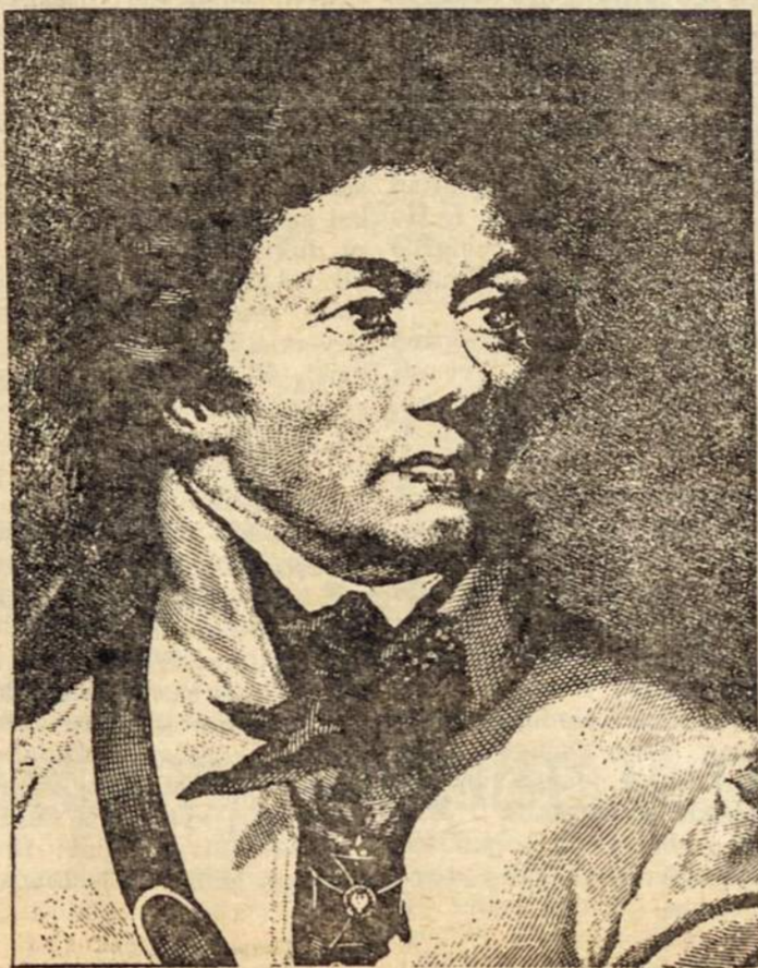
Gen. Tadas Kosciuszka (1746—1817)