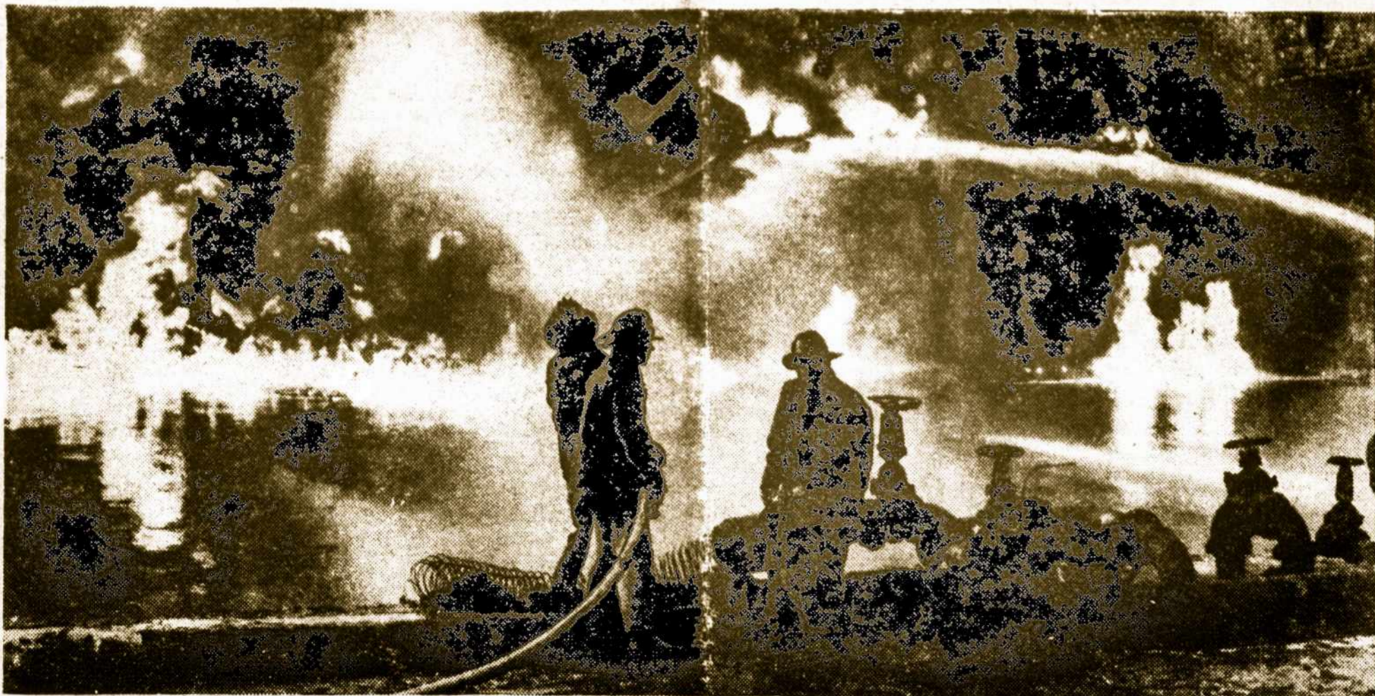
Vaidas iš petroleo laivų Islas Orcadas, Cutral-Co ir Fray L. Beltran gaisro 5. 5. 68 naktį. Liepsnų jūra pakilo virš Berisso ir Ensenados. Nuo baisių sprogimų sutrūko daug namų La Platoj, išbyrėjo langai. Nuostoliai virš 3.500 milijonų pezų. Žuvo 4 būdotojai.