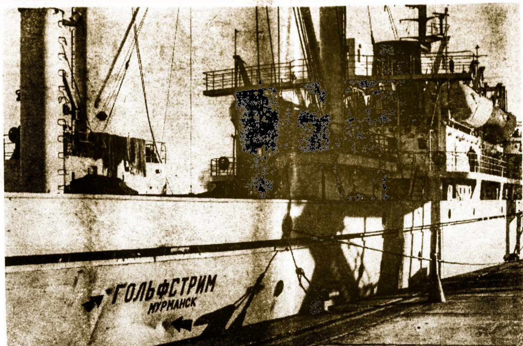
Tarybų Sąjungos žūklės laivas „Golfstrim“ iš Murmansko, žuvalvės teritorialiuose Argentinos vandenyse, 22. 6. 68 Argentinos naikintuvo „Santa Cruz“ tapo apsaudytas ir priverstas plaukti į Mar del Plata uostą. Kitas TS laivas „Pavlovo“ pabėgo į Montevideo uostą. (Nuotraukoje matosi šovinių padarytos žymės). „Golfstrim“ igula — 97 vyras ir 8 moterys — gavę leidimus, pasivaikščiojo po Mar del Plata. Prisimintina, kad pernai Buenos Aires bėgte 4 mėnesius išbuvo TS laivas „Mitchurinsk“, kol baigėsi „diplomatinio багаžo“ byla. Kapitonas ir igula išsteisinta. Šiomet „Mitchurinsk“ vėl bavo atplaukęs į Buenos Aires, savo normalėje prekių atvežimo ir išsigabenimo kelionėje.