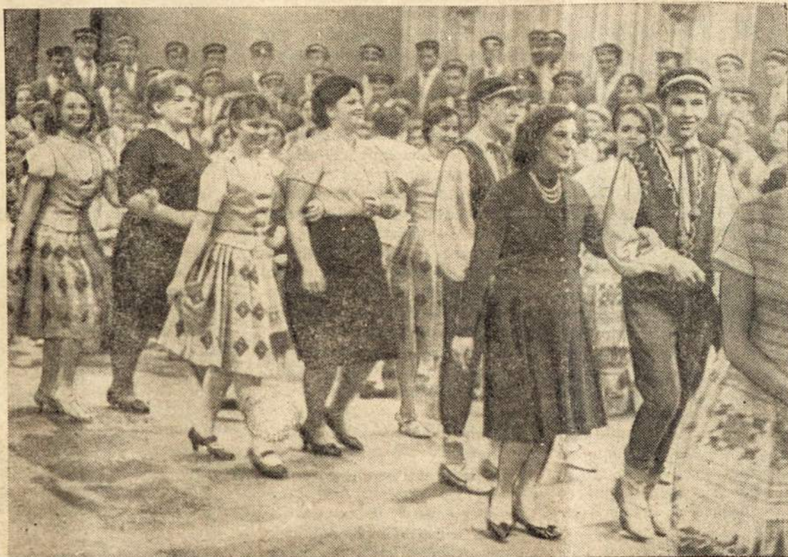
Lietuvos universitetuose šiandien yra 45.000 studentų. Čia juos matome bendraujant su visuomene įvairiomis progomis.