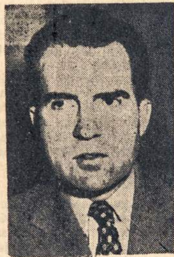
RICHARD M. NIXON,

— Vakarų Vokietijos u. r. min. Willy Brandt pareiškė spaudos atstovams Berlyne, kad V. Vokietija jau dabar vykina prekybos mainus su komunistine Kinija, o greitai ateity tie mainai bus žymiai padidinti.