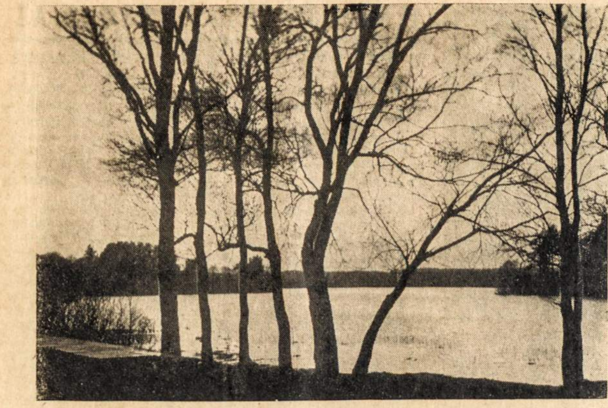
Vieno Lietuvos ežero vaizdas. Vasara malonu po darbo atsigaivinti kristoliniame Lietuvos ežerė.