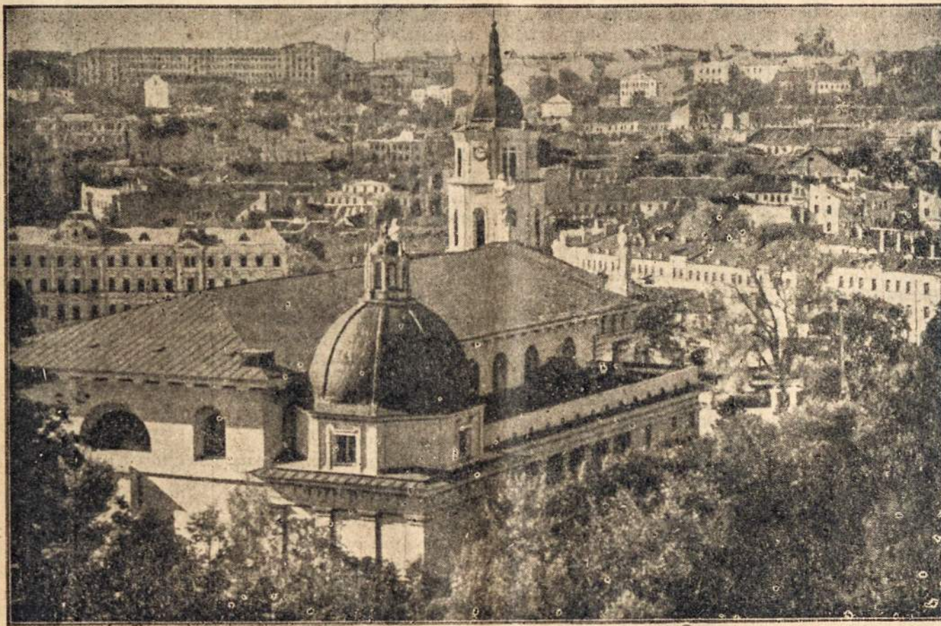
Mūsų sostinės Vilniaus miesto bendras vaizdas. ... Kur senamiestis — tarsi gyvas muziejus. Kur kolonų būriai, puošnių bokštų didybė, sustingęs išgraizintų fasadų džiugsmas ir liūdesys... Kur, klajodamas jausiais skersgatviais ir vingriomis gatvelėmis, gali be galo klausytis žilųjų amžių kalbos. Kur kiekvienas akmo, kiekviena plyta tyliai pasakoja apie Vilniaus praeitį...