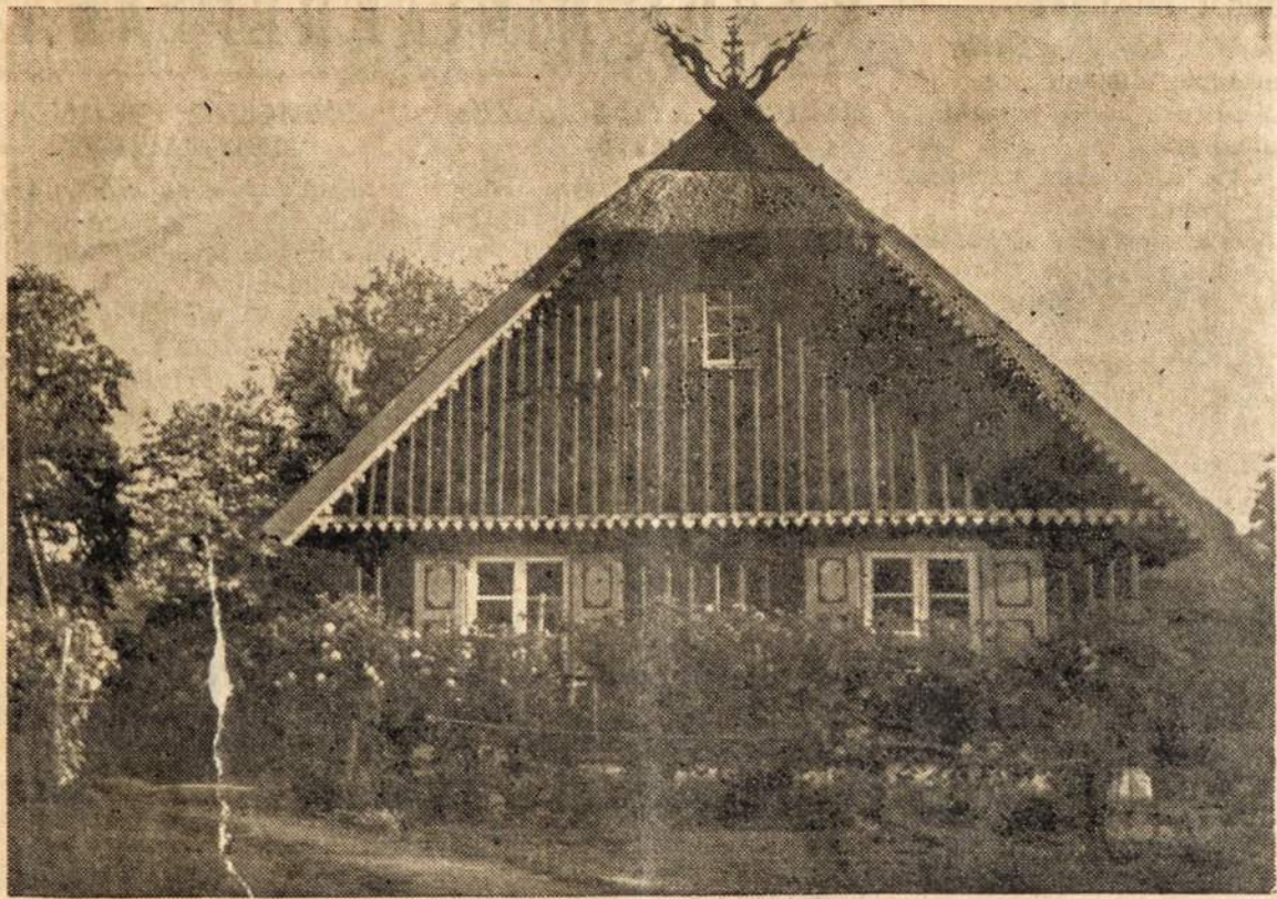
Ar atsimeni nan elį... Tėviškės sodybą, kurioje užaugai. Ar dažnai apie ją pasvajoji?