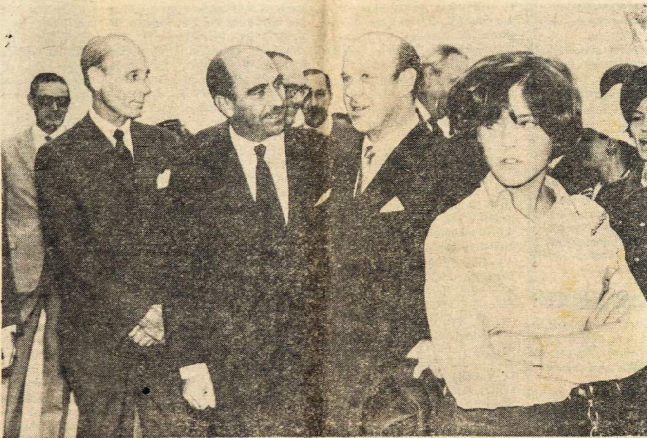
Argentinos u. r. min. dr. Nicanor Costa Mendez, aplankęs Vakarų Europos sostines, susitpirindamas ryšius, prezidentui gen. J. C. Ongania pateikė platų pranešimą 16. 4. 69. Dr. Mendez (pirmoj eilėj trečias iš kairės) dalinasi išpuožia's su spaudos atstovais.