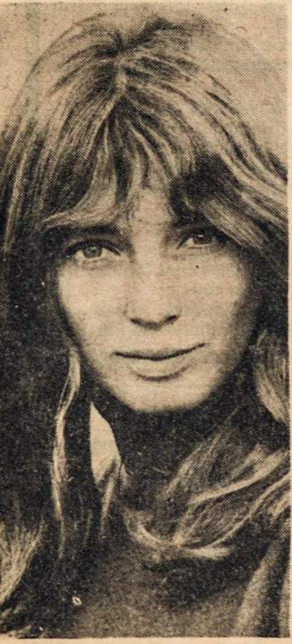
JOANA SHIMKUS, Kanados lietuvaitė, Prancūzijos filmų žvaigždė, kuri sykiu su Elizabeth Taylor ir Richard Burton dalyvavo filmo „Boom“ pastatyme. Dabar, sykiu su Sinatra, ji pasirašė ilgalaikę sutartį su Hollywoodo filmų bendrove Universal.