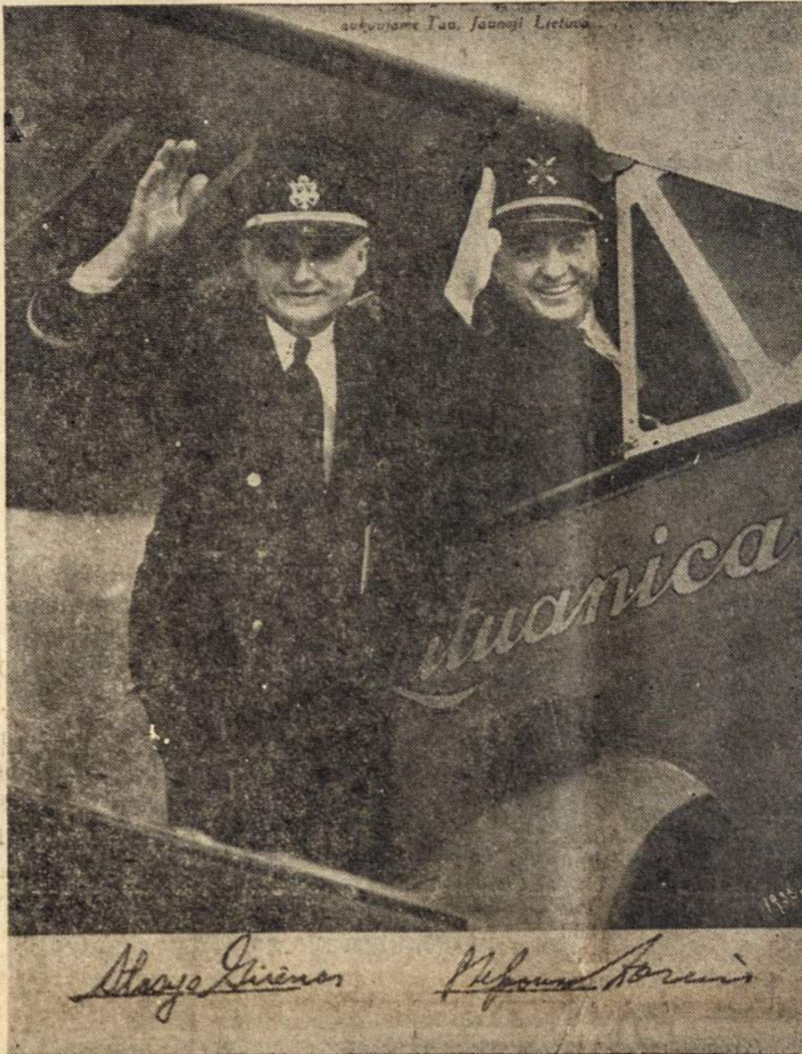
DARIUS ir GIRĖNAS prie LITUANICOS, kuria perskiedę Atlantą žuvo 17.7. 33. Apie Lituanicos didvyrius, paaukojusius savo gyvybę mūsų tautos garbei A. L. Balsas ruošia naują leidinį, kuris greit išeis iš spaudos.