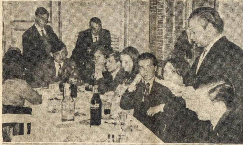
SLA Centro delegacija, nuvykusi Kordobon, 10. 8. 69 susitinka su 6 skyriaus veikėjais, to skyriaus 25 metų veiklos sukaktį minint.