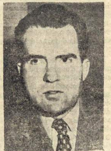
RICHARD M. NIXON,

JAV prezidentas, 3. 11. 69 pasakiusis didelę kalbą, sukakus metui laiko po jo išrinkimo. Teisinosi dėl nebaigimo karo Vietnam, žadėjo draugiškesnius santykius su Pietų Amerikos šalimis. Jam pritaria tik Respublikonų partija. Opozicija teigia, kad jis šalį traukia vis gilesnėn bedugnėn.