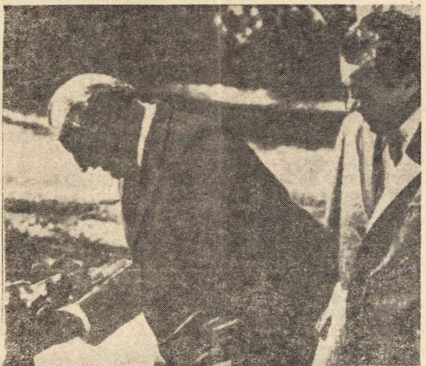
Prancūzijos prezidentas Georges Pompidou su JAV prezidentu Richard Nixon, aptarė savo šalių santykius ir pasaulinės politikos reikalus, vaikščioja po Baltųjų Namų sodą. (Pompidou glosto šunį). Sveičiui su žmona lankant Chicago ir kitus miestus minios protestavo prieš Prancūzijos politiką Viduriniuose Rytuose. Pompidou Vašingtono kongrese pasakė, kad žydai turėtų paštraukti iš okupuotų arabų žemių.

— Argentinos rašytojas Jorge Luis Borges ir Čilės poetas Pablo Neruda yra tarpe 14 Oklahomos universiteto dvimetinės premijos kandidatų. Premija 10.000 dolerių.