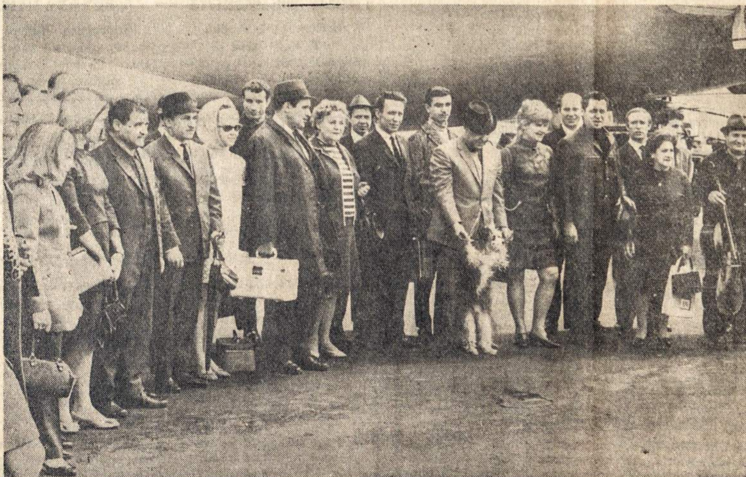
Dalis Circo de Moscu artistų, 21. 3. 70 išlipusių iš lėktuvo aerouoste Ezeiza. Jie dabar stebina žiūrovus Buenos Aires Luna Parko stadione. Su žuniuku — garsiausiu pasaulio klounas Oleg Popov. Po gegužės 5 Circo de Moscu vyks į Chile, Peru, Ecuador ir Venezuelą.