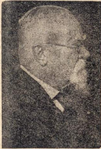
Dr. JONAS ŠLIŪPAS,