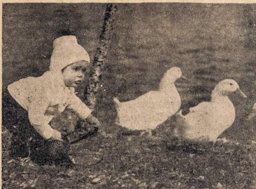
Vaikučių auginimas — didžiausias motinų rūpestis. Gražiai aprengtas vaikutis žaidžia gamtoje. Šis vaizdas visiems primena laimingas kūdikystės dienas.