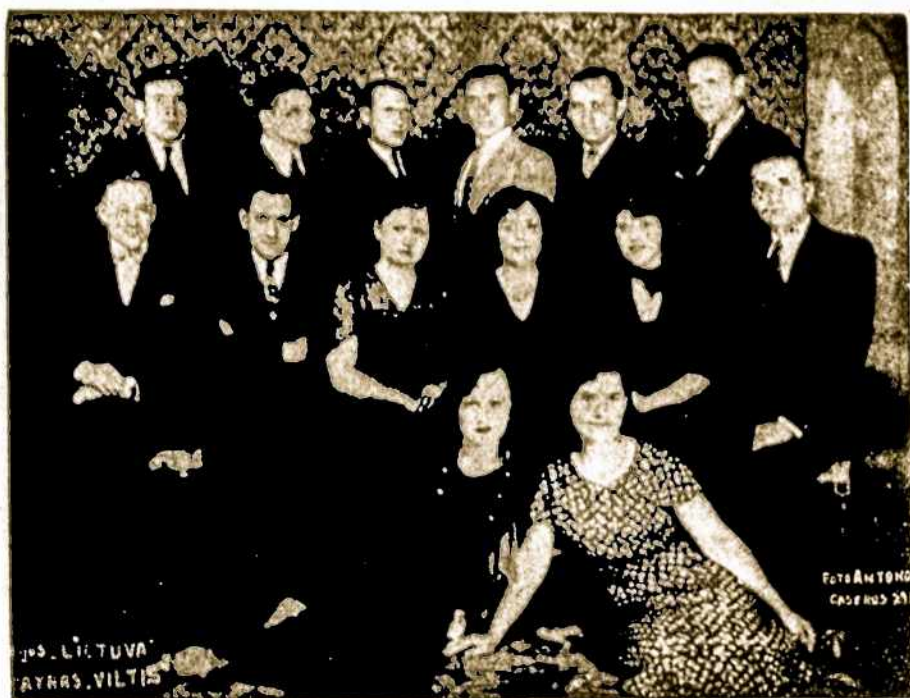
Pastabas apie vaidybos meno likimą Argentinos lietuviuose papuošime Lietuvos — A. L. Centro Teatro Viltis vaidintojais, kurie daug puikių veikalų pastatė mūsų scenoje. Kai kuriuos jų matysime vaidinant A. L. Centre šį šeštadienį.