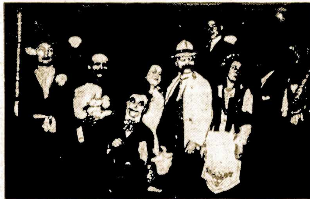
Šioje nuotraukoje matome prieš daugelį metų Argentinos lietuvių scenoje vaidintų Varnalėjų artistus. Dalis jų ir dabar veikia mūsų scenoje. Neužmirškite, kad ši šeštadienį, gruodžio 5, 1970, 21 val. A. L. Centro scenoje vaidinama Neturtas — ne yda. Įkanga nemo-kama visiems!

Užsakymus su apmokėjimu adresuokite: A. L. Balsas, J. L. Suarez 5684 (Suc. 39), Buenos Aires.