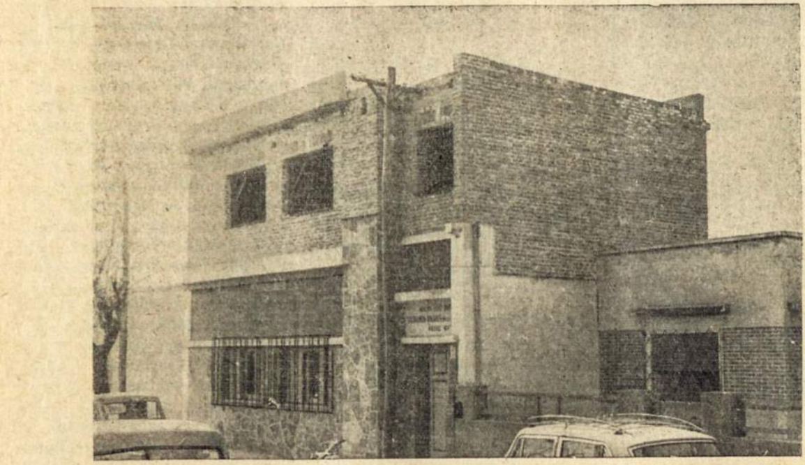
SLA 6 skyriaus namai Kordoboje, Eufrazio Loza 1070. Čia vystomas lituanistinis veikimas, veikia biblioteka. Šio SLA skyriaus pastangomis kaimyninei gatvei gautas vardas Lituania. Didelė kordobiečių ekskursija dalyvavo SLA veiklos 57 metų sukakties minėjime.