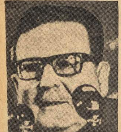
Argentinos prezidentas gen. Lanusse ir Čilės prezidentas dr. Allende, kurie susitiks Saltoje 23.7.71.