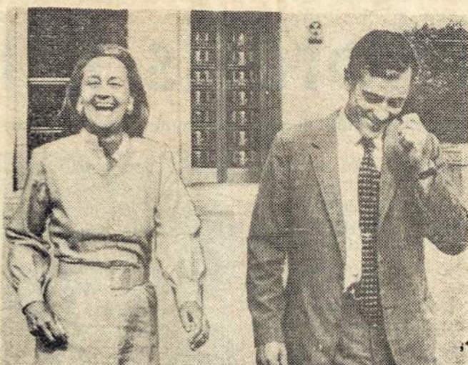
Dienraščio Washington Post direktorė Katherine Graham ir red. Ben Bradlee išeina iš teismo JAV sostinėje 22.6.71, po uždraudimo skelbti Vietnamo karo pastaltis.

Kiti bus veikę, jūs nieko. Kaltiesite kitus, kam Jūsų darbų nevertino, o kas dėl to bus kaltas? Tik pagalvokit, atsakymo nereikia.