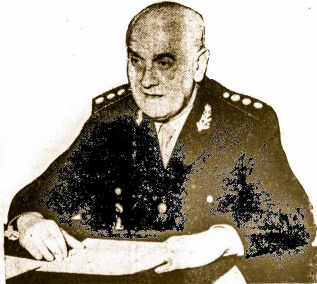
Argentinos Respublikos prezidentas gen. Alejandro Agustin Lanusse, po operacijos sveiksta.

Dabar susitarta su TSRS importuoti 50.000 tonų kviečių, mainais už Kolombijos kavą.