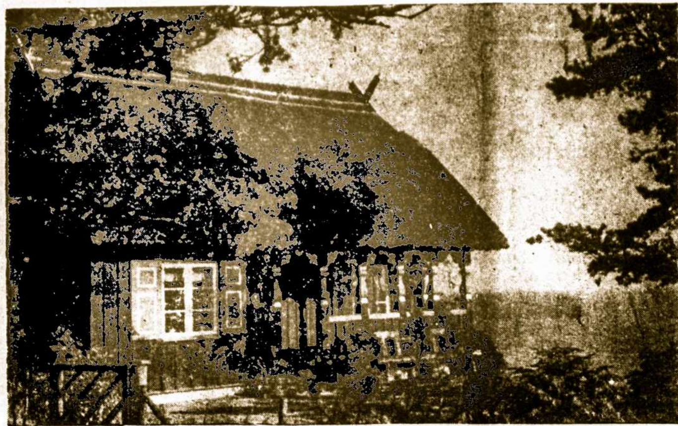
Žavėtinus Nidos vaizdas. Čia šią vasarą vasarojo daugybė turistų.

Pabrangus paštui atsilikusiems prenumeratoriams Argentinos Lietuvių Balso siuntimas kreditan sustabdomas.