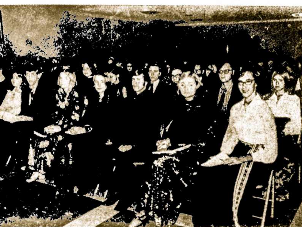
Pedagoginio Lituanistikos Instituto absolventų vakaras (1971. XII. 11): pirmose dviejose eilėse — absolventai diplomų įteikimo metu. — Nuotr. V. Noreikos.