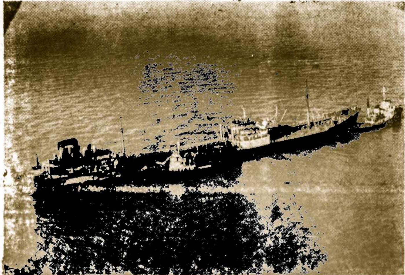
Liberijos tanklaivis Tien Ohee, po susidūrimo su angliu laivu Royston Grange. Jis gabeno 20.000 tonų naftos, kuri išsilėjo į sudagę virš La Platos vandens.

FERNANDEZ & TIMINSKAS, sav. SERVICIO DE CALIDAD — AMBULANCIAS — SEPELIOS — CASAMIENTOS T. E. 243-5654 CASA CENTRAL: Av. H. Irigoyen 11070. Turdera Skyriai: Balneario 510 — Lomas de Zamora. Pasco 2923 — San Jose (Temperley). Las Heras y Arana — Monte Grande. — Ruta 205 — Ezeiza. Laprida 1799 — Lomas de Zamora. Av. Azopardo y 25 de Mayo — Longchamps. Seniausia lietuvių vadovaujama laidojimo įstaiga.